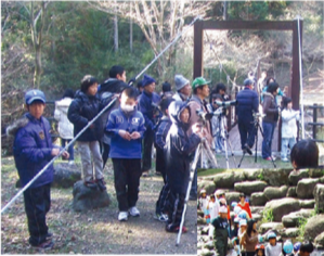
バードウォッチング

鳥の声に耳を済ませ、図鑑片手にバード・野草ウォッチング。また、花々や周囲に広がる愛鷹山系に心奪われながらのハイキングや川登りは、自分を取り戻す一日を約束してくれるはず。