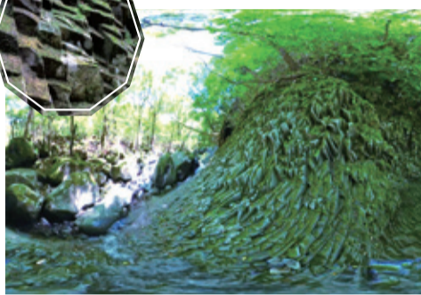
▲360度カメラによるイメージ画像