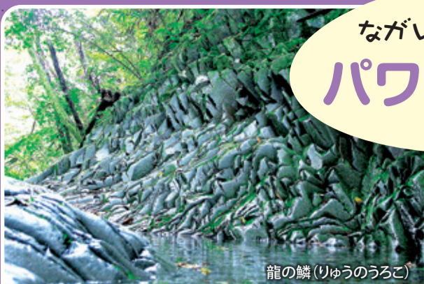
龍の鱗(りゅうのうろこ)