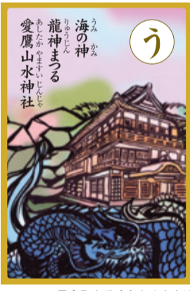
長泉町ふるさとカルタより