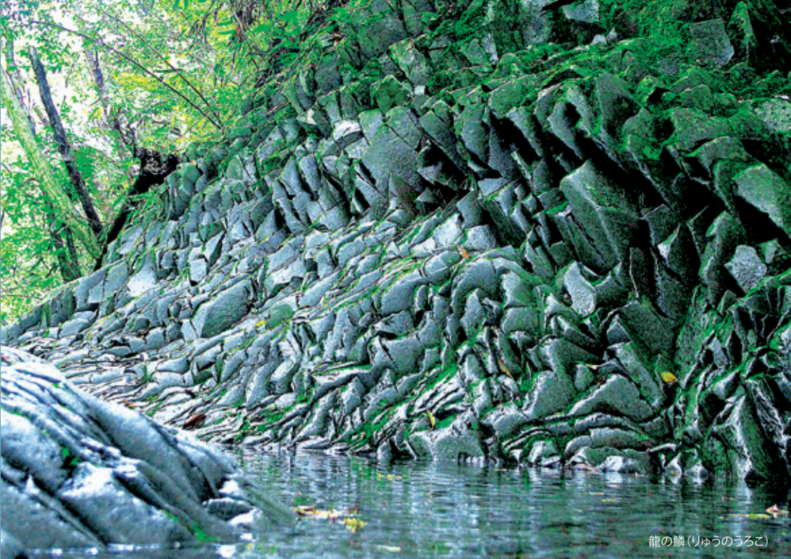
龍の鱗(りゅうのうろこ)