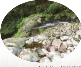
▲滝上流の板状節理