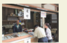
祈祷受付・売店(行事の時のみ)