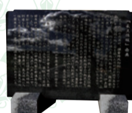
長久保城の面影残る 史跡の数々…。