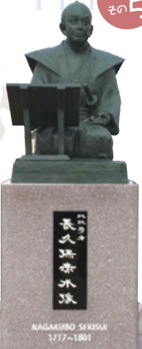
長久保赤水像 (茨城県高萩市)

伊能忠敬の日本地図は、幕命による実測図であり、国防上不公開だったが、反面、赤水図は実測図ではないが、ほぼ正確な海岸線・地名・縮尺及び緯度経度を持ち、修正を続けた後それ以前の地図とは一線を画す優れたものとなり、明治初期まで一般に使われ、かの有名な吉田松陰も使用した。