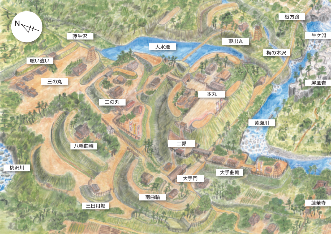
▲400年前の長久保城イメージ図