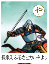
長泉町ふるさとカルタより