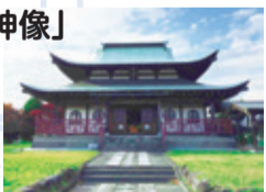
「八幡神像」のある西願寺

長泉町指定有形文化財の「八幡神像」は、長久保城の守護神で八幡曲輪にまつられていたが、長久保城廃城後、香州元硬禪師が西願寺を創建した際、同時にまつられることになったという。