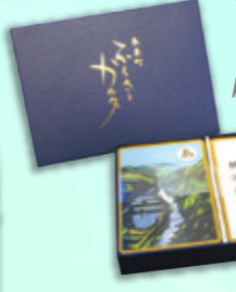
▲長泉町ふるさとカルタダイジェスト版▶