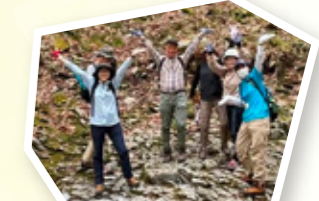
ながいずみまち歩き