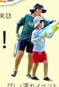
びしょ濡れイベント