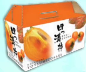
四ッ溝柿の化粧箱