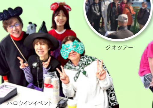
ハロウィンイベント