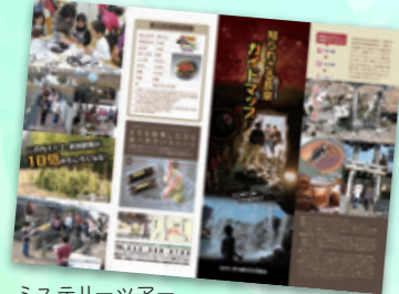
ミステリーツアー