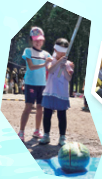
ワンデーチャレンジ