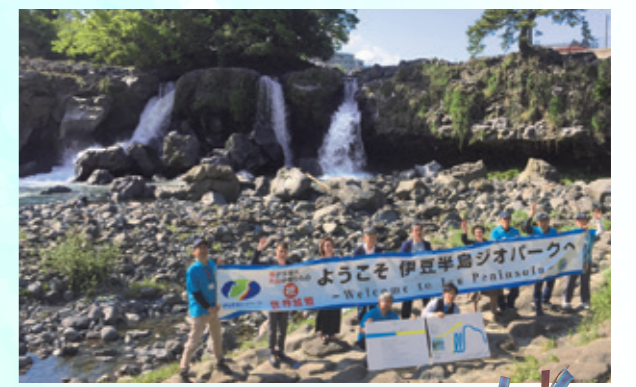
伊豆半島ジオパークユネスコ世界遺産認定