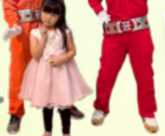
美味戦隊トクサンジャー