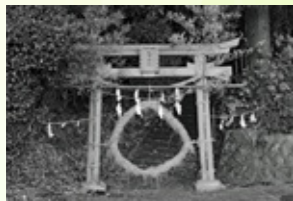
入選 勝又 説夫さん「桃沢神社の茅の輪」※桃沢神社