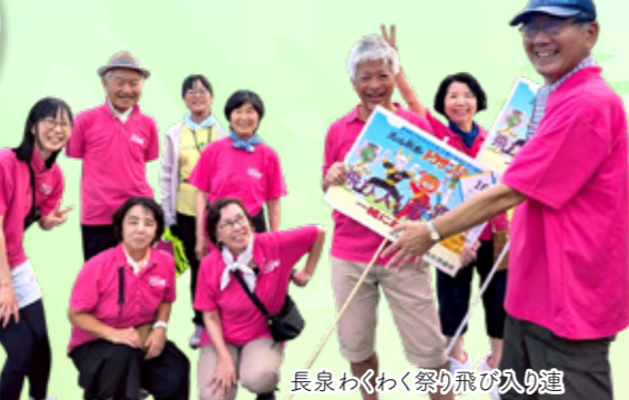
長泉わくわく祭り飛び入り連