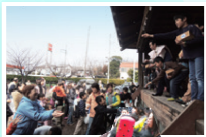
豆まきと昔の遊び