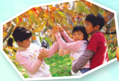
柿狩り&「渋抜き・干し柿」体験