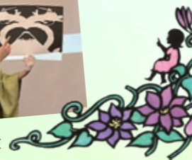
重ね捺し版画の旅企画