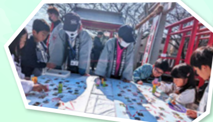
長泉町ふるさとスゴロク