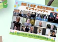
オンラインツアー