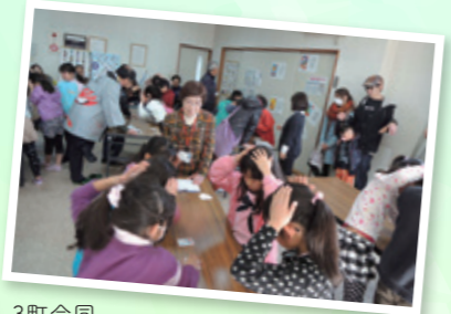
3町合同カルタ大会