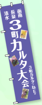
3町合同カルタ大会