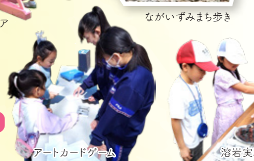
アートカードゲーム