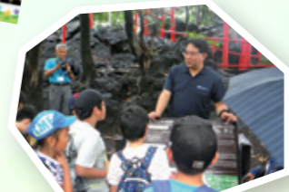
小学生ジオパーク講座